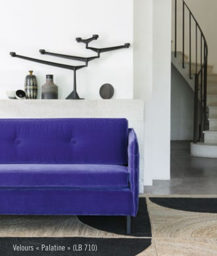
Velours « Palatine » (LB 710)