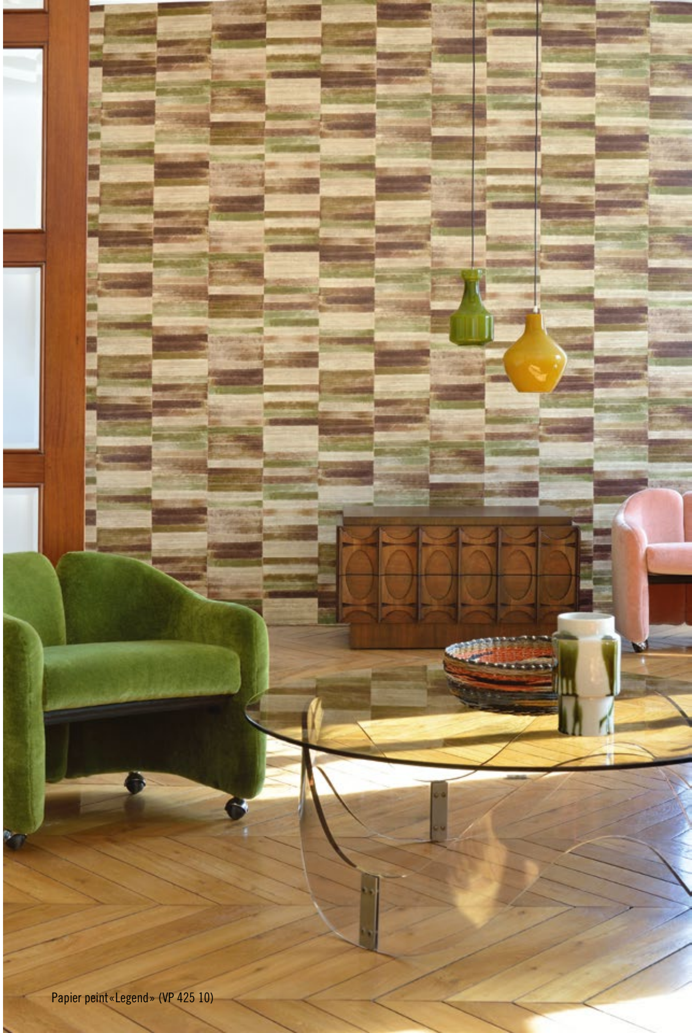
Papier peint«Legend» (VP 425 10)