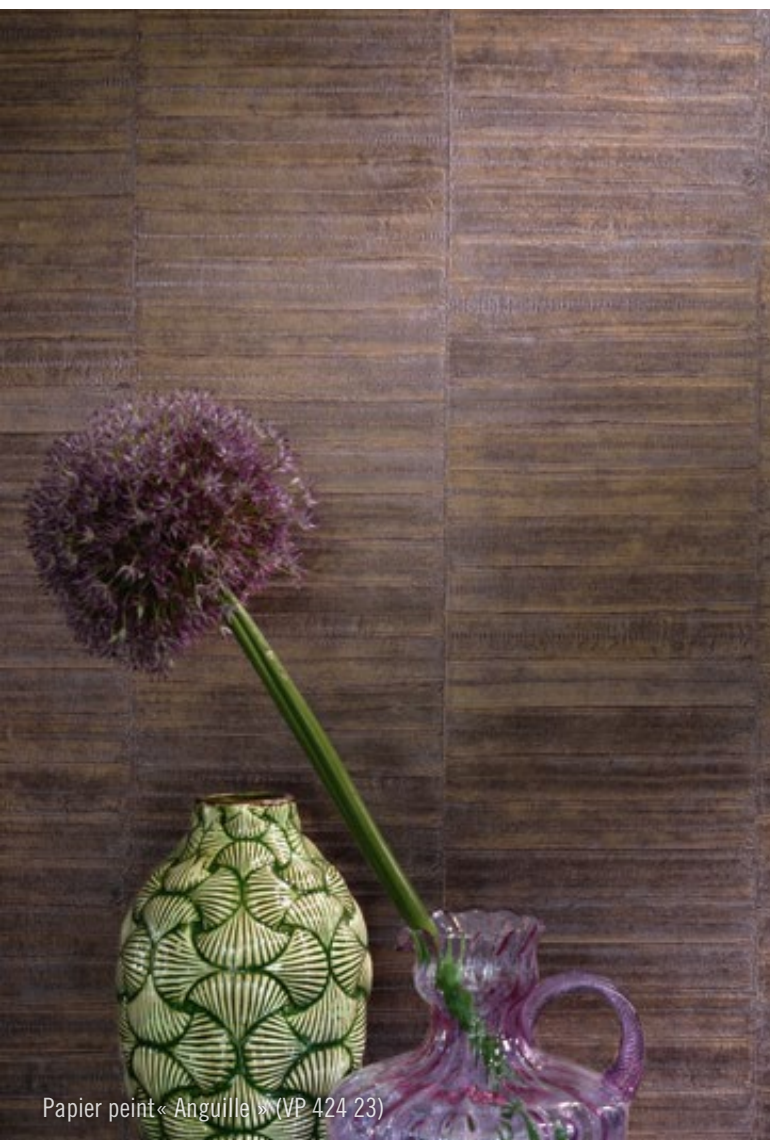
Papier peint « Anguille » (VP 424 23)