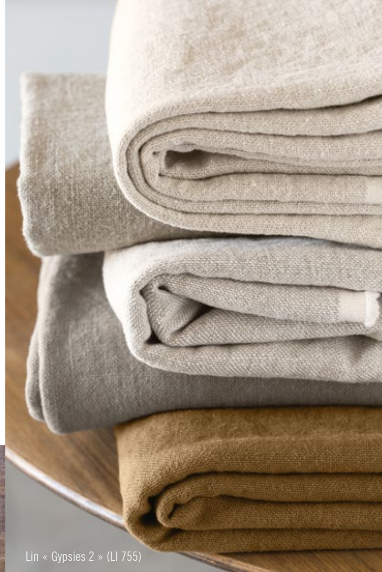
Lin « Gypsies 2 » (LI 755)