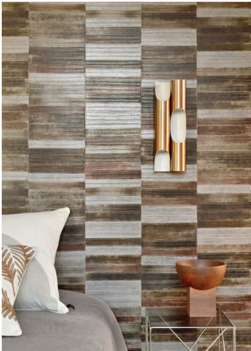
Papier peint«Legend» (VP 425 09)