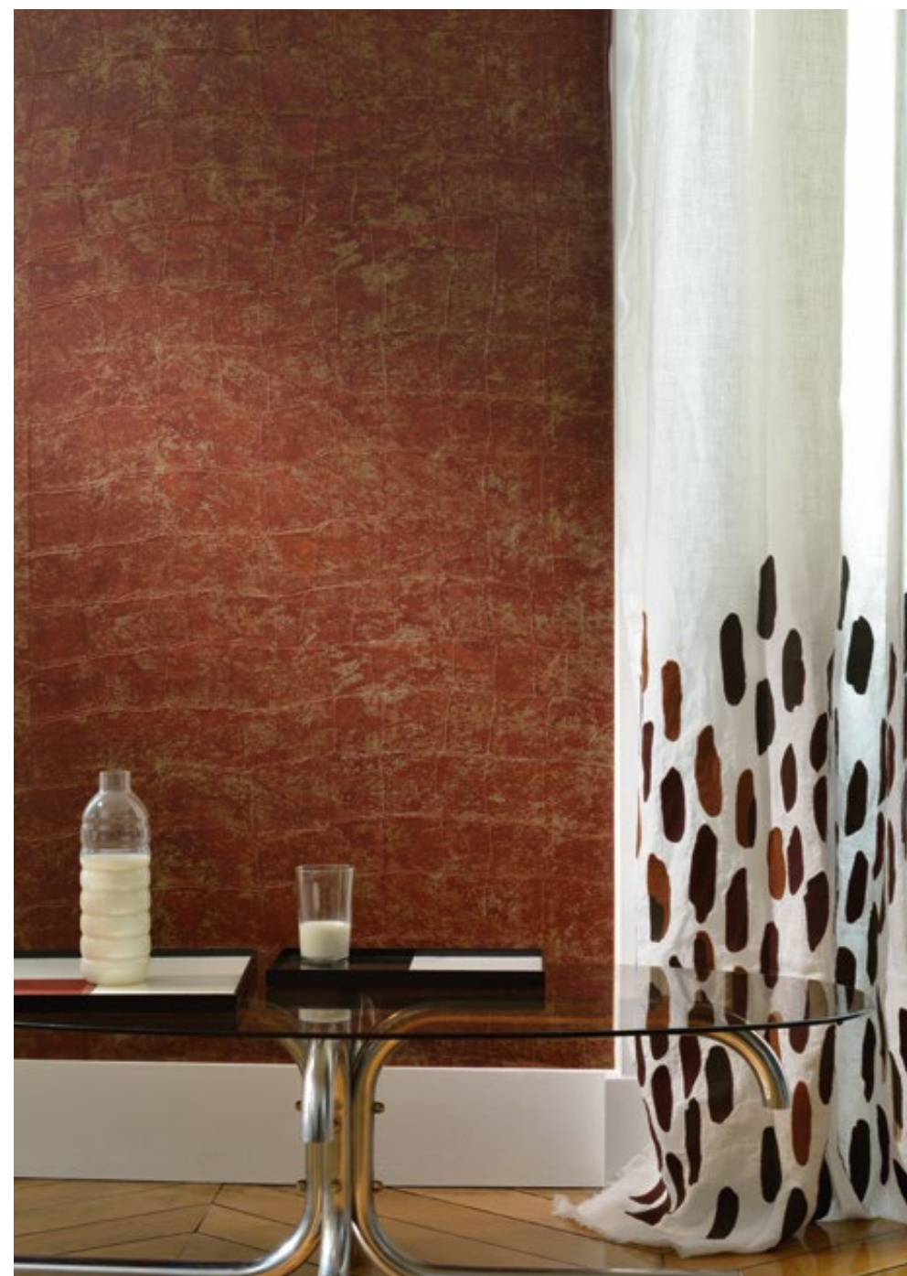
Papier peint « Big croco » (VP 426 07)