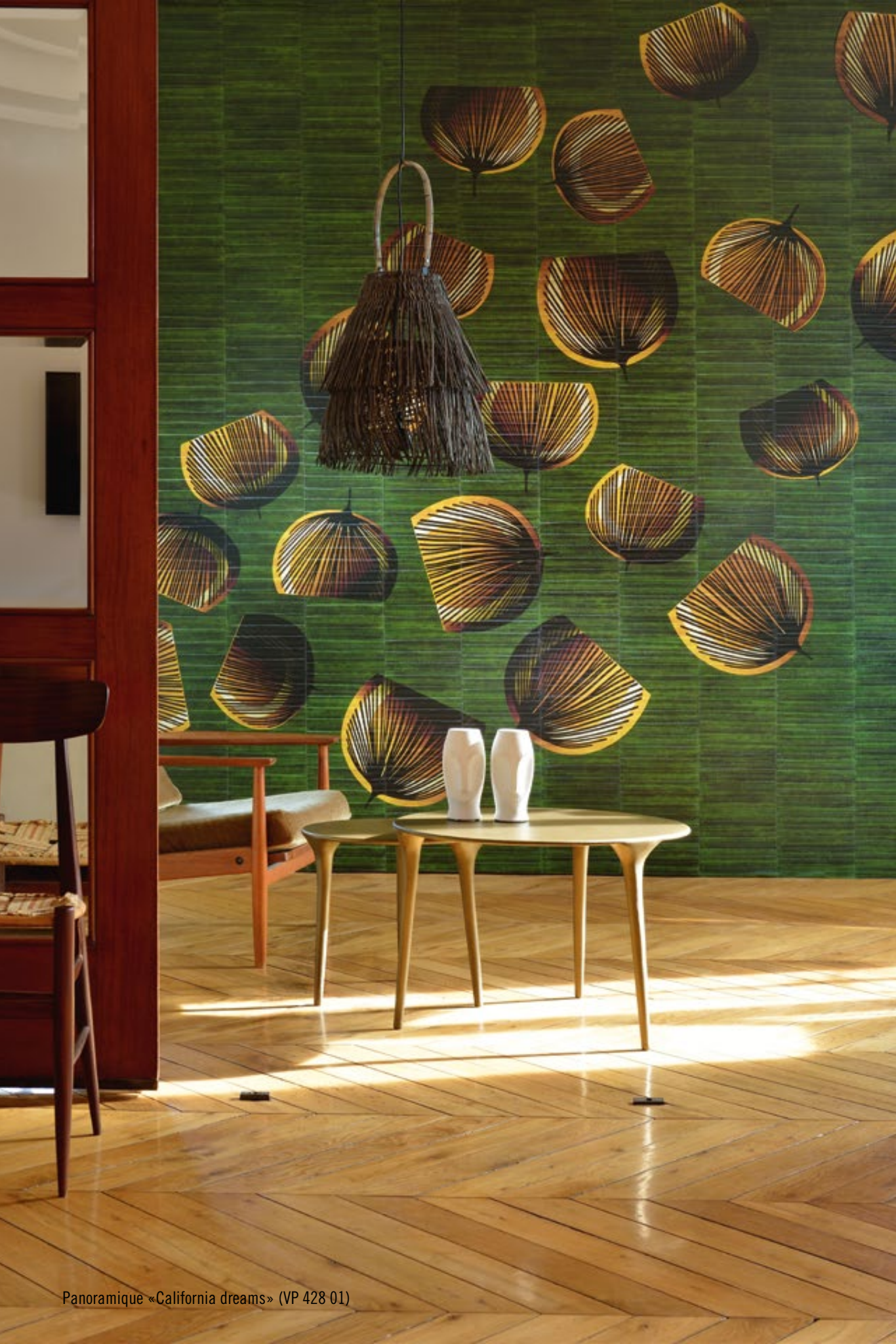
Panoramique «California dreams» (VP 428 01)