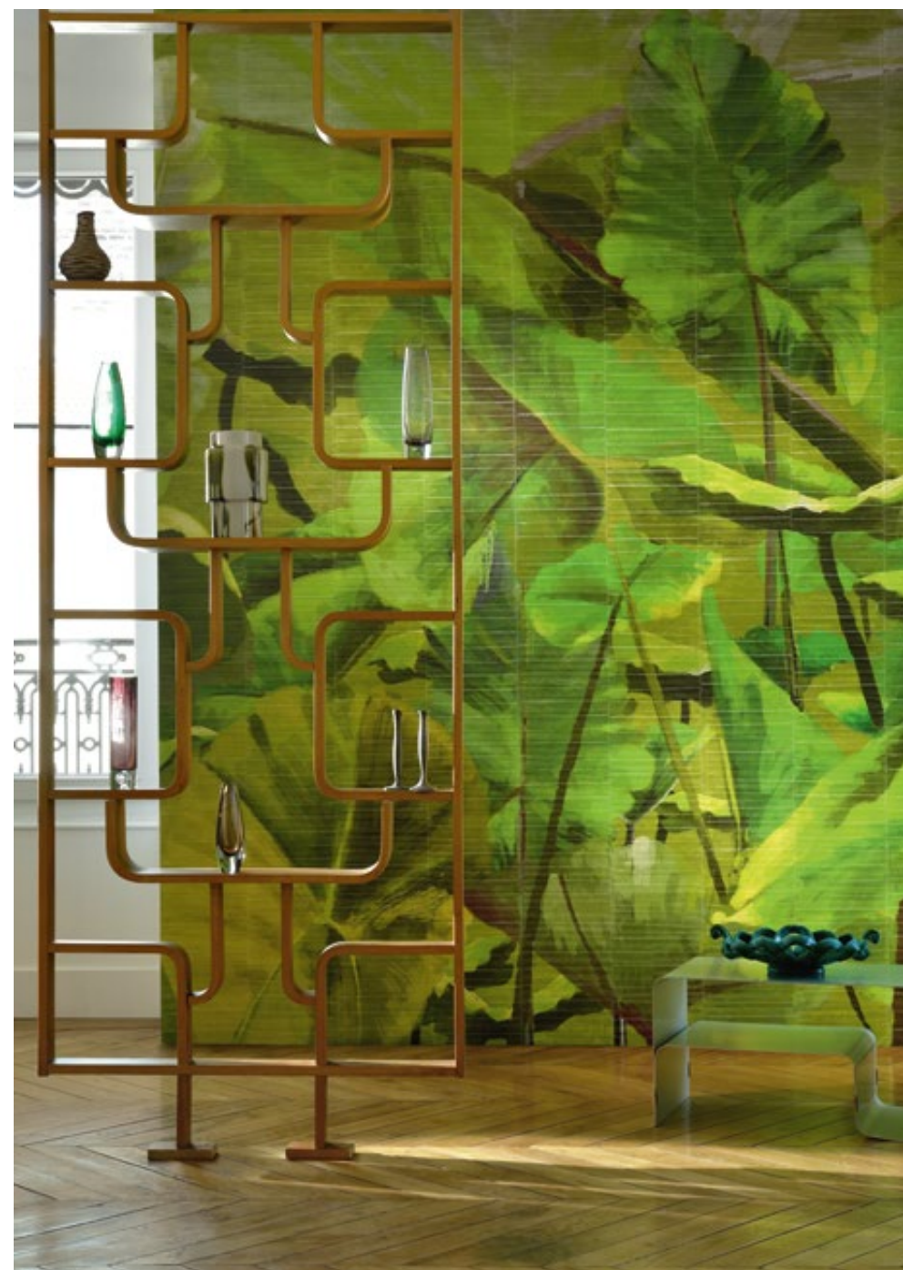
Panoramique «Lost in plantation» (VP 429 01)