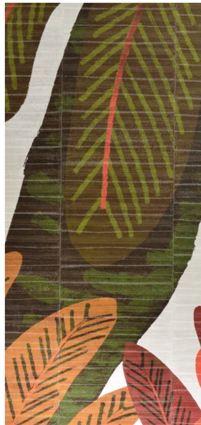
Panoramique «Waiting for Eve» (VP 427 01)