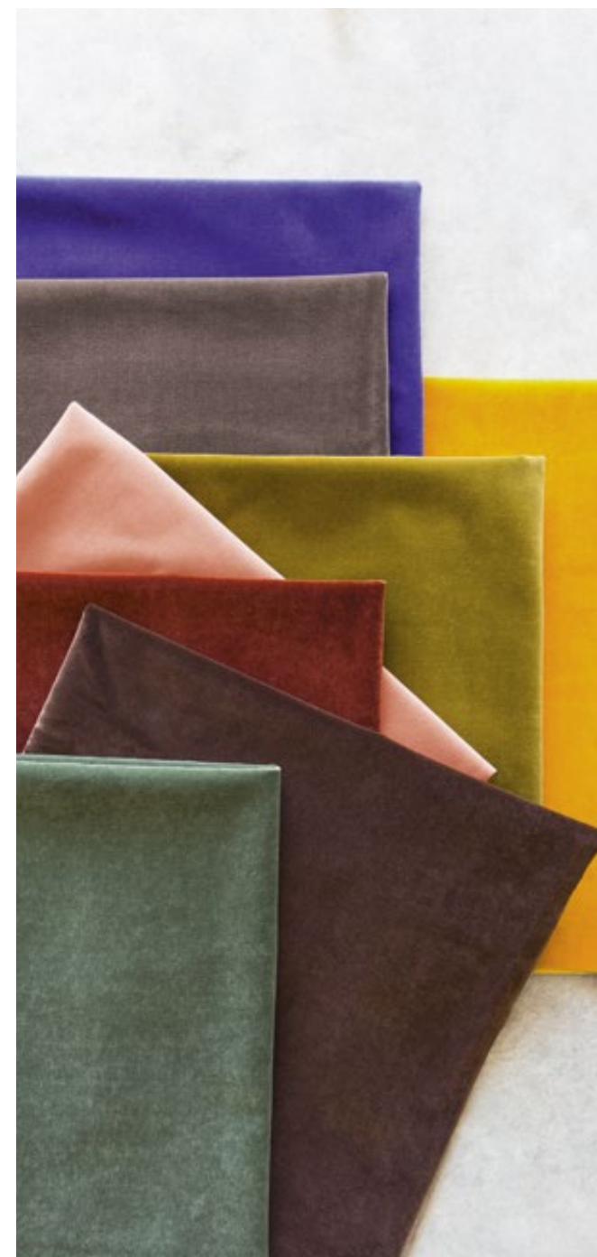
Velours «Palatine» (LB 710)