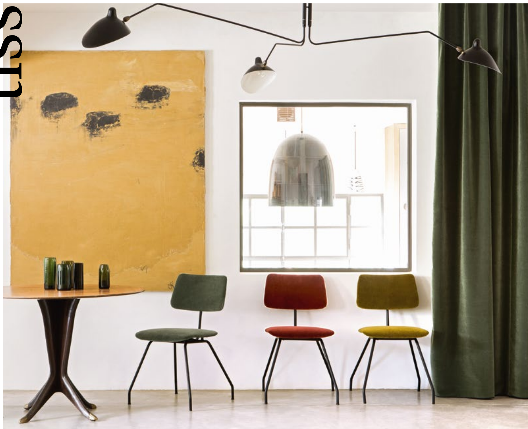
Velours «Palatine» (LB 710)