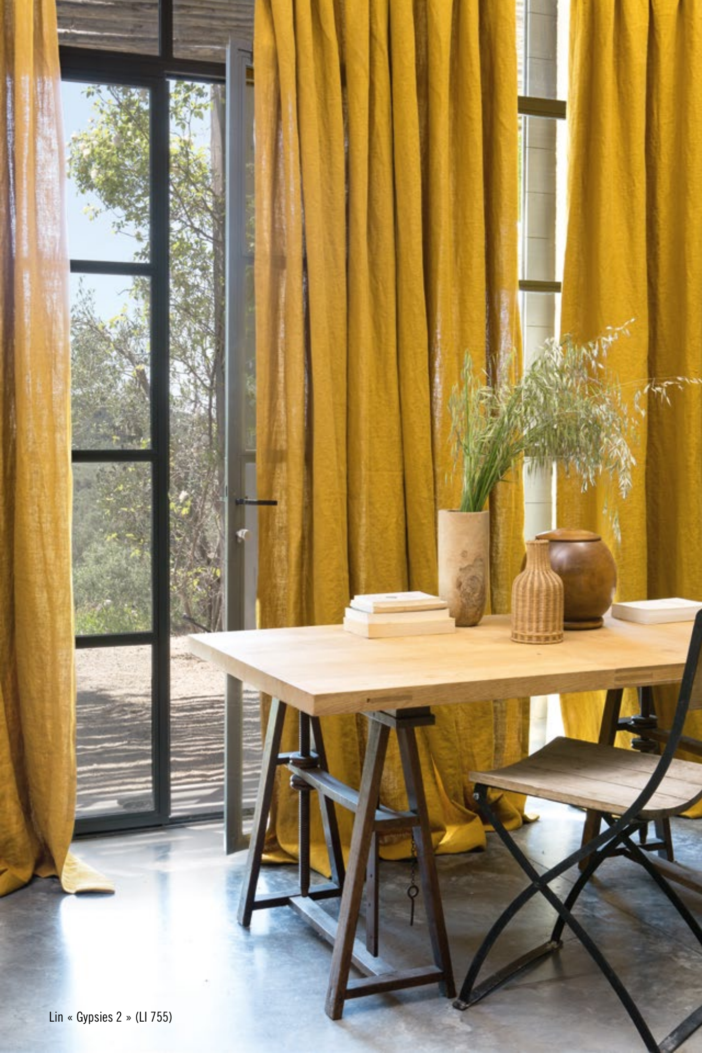
Lin « Gypsies 2 » (LI 755)