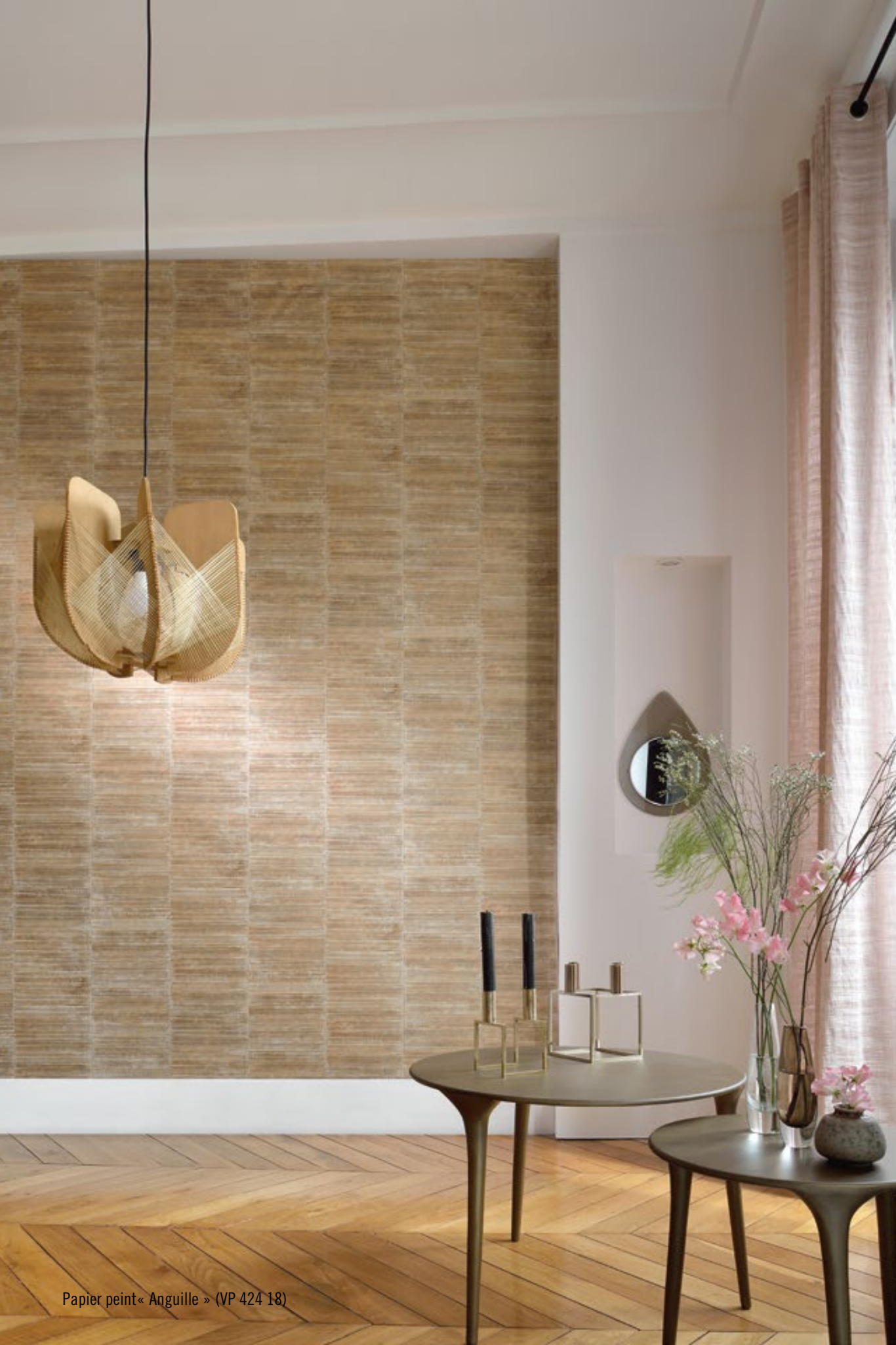
Papier peint « Anguille » (VP 424 18)