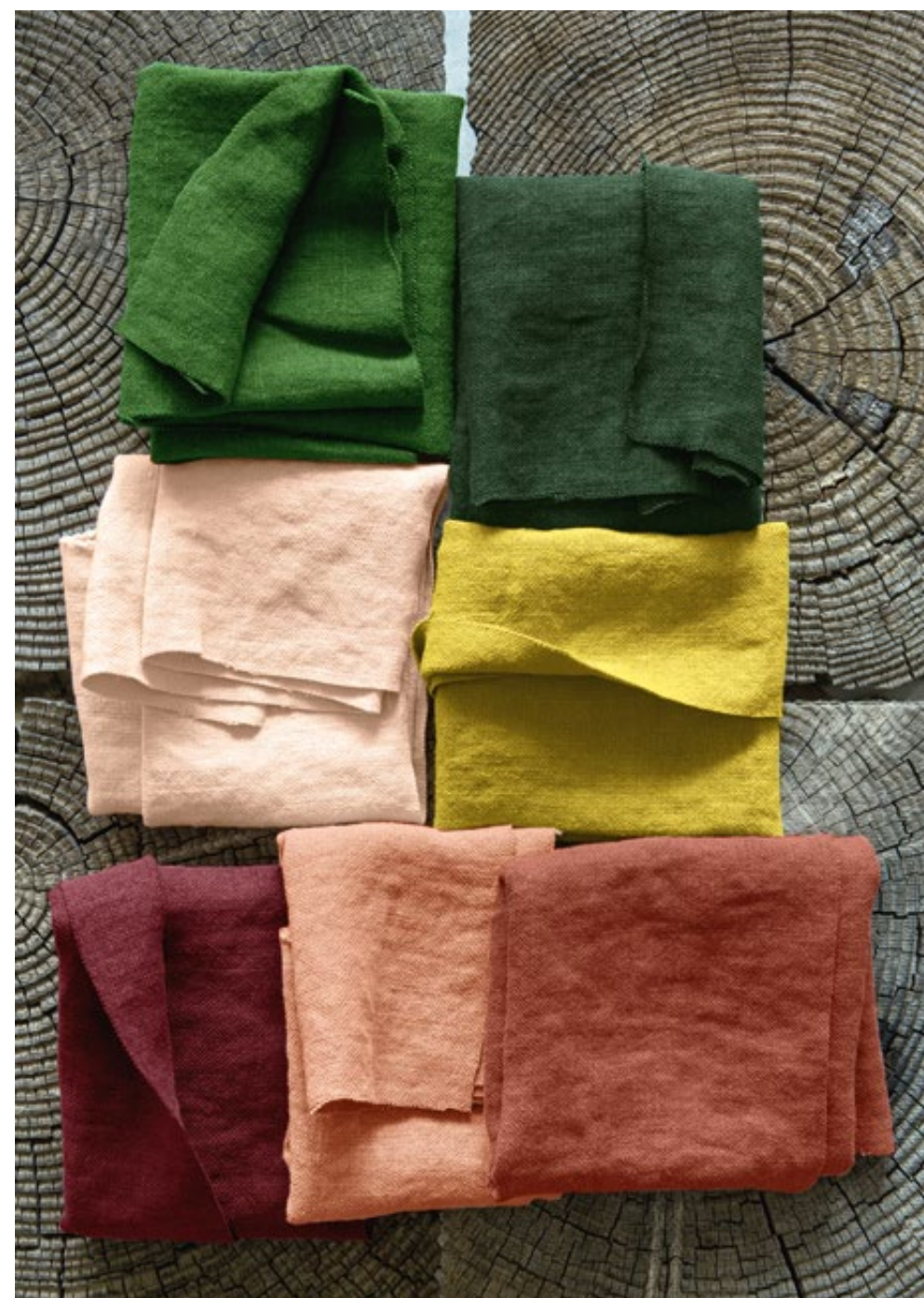
Lin « Gypsies 2 » (LI 755)