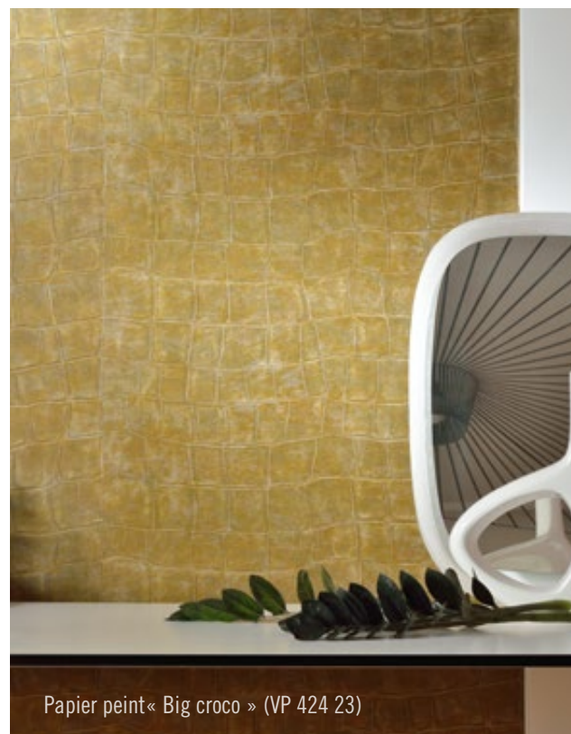
Papier peint « Big croco » (VP 424 23)